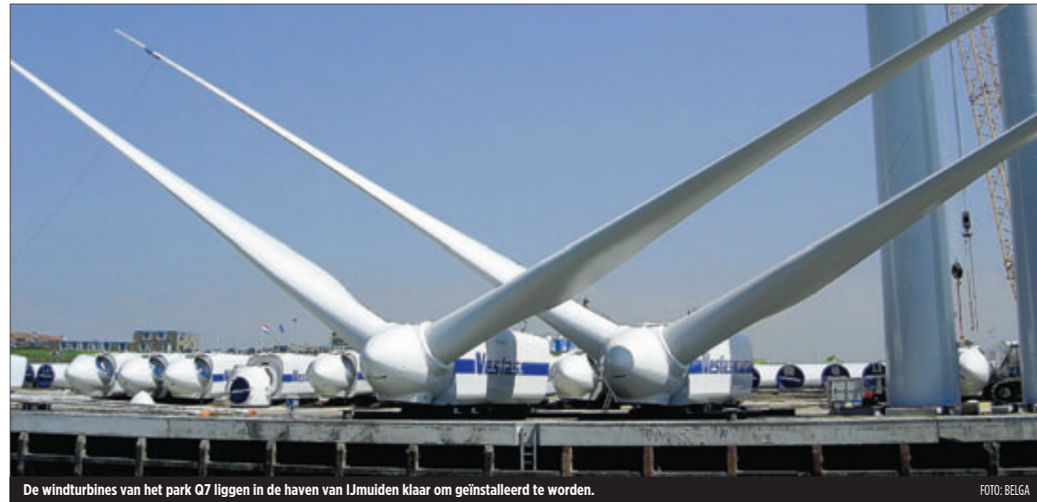
De windturbines van het park Q7 liggen in de haven van IJmuiden klaar om geïnstalleerd te worden.

De 36 windturbines van het nabijgelegen windenergiepark van Nuon en Shell tonen weinig beweging. Door de zwakke wind tonen de wieken van amper twee windmolens enige beweging. 'Geen enkel probleem', klinkt het bij de ingenieurs van Econcern. 'Enkele windstille dagen horen er nu eenmaal bij. We schatten dat de turbines omgerekend 3.500 dagen per jaar op maximaal vermogen zullen draaien.' Ter herinnering, een jaar telt 8.760 uren. Het park Q7 (120 megawatt) zal jaarlijks minstens 420 miljoen kilowattuur stroom produceren, het jaarverbruik van pakweg 120.000 gezinnen.